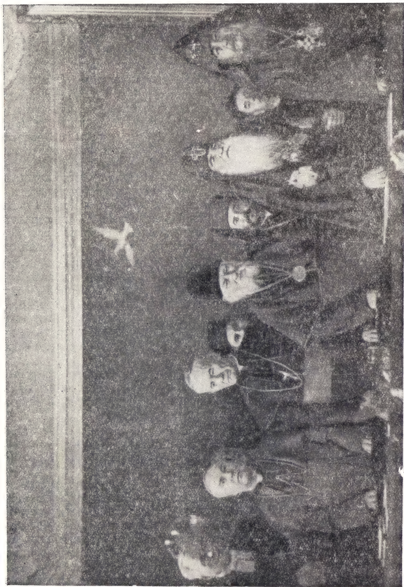
В ПРЕЗИДИУМЕ КОНФЕРЕНЦИИ